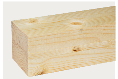
tr Fichte astig natur