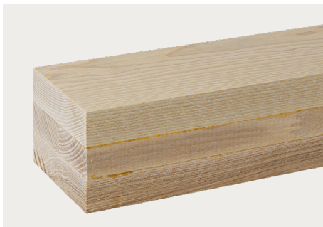
Esche Natur dkd Decklage weiss

→ Kombinationen aus verschiedenen Holzarten siehe Seite 18.