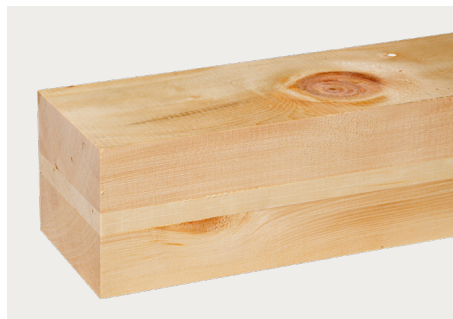
tr Arve natur